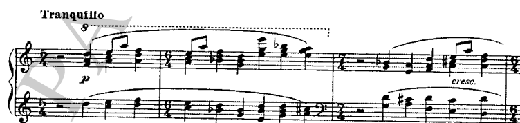
ภาพที่ 5.5 แสดงการเปลี่ยนบันไดเสียงและแนวประสานในเพลง Promenade

ในการเล่นครั้งที่ 3 มีการนำโมทีฟมาปรับใช้เป็นบทนำก่อนเข้าทำนองหลักในแนวเสียงสูง และมีการใช้แนวประสานจากบันไดเสียงโครมาติก เพื่อนำไปสู่เพลงต่อไปที่บรรยายถึงบรรยากาศที่สนุกสนาน