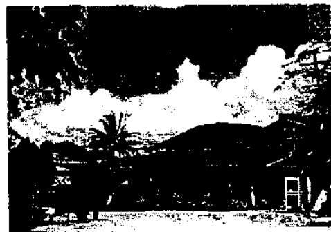
ภาพที่ 6 สถานที่เลี้ยงเด็กกำพร้าและที่อยู่อาศัยคนพิการ อ.ไชยปราการ จ.เชียงใหม่