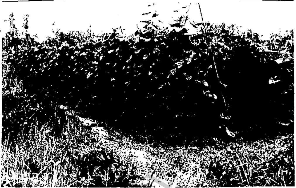
การปลูกพืชนอกฤดูกาล เช่น ยาสูบ พริก ถั่ว