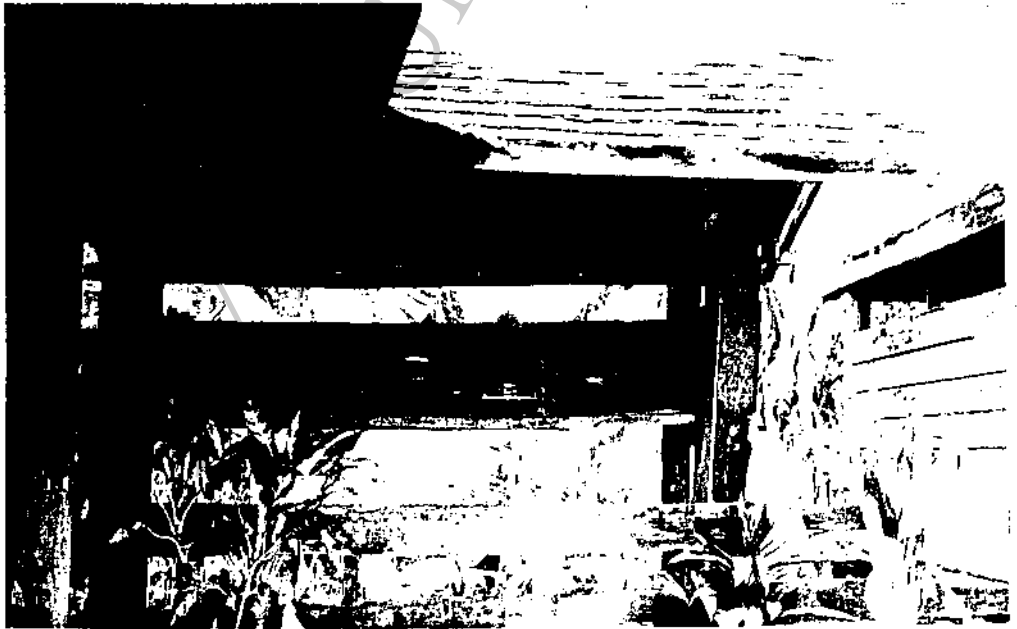
ฮ้านนำอยู่ใกล้กับหลองข้าว