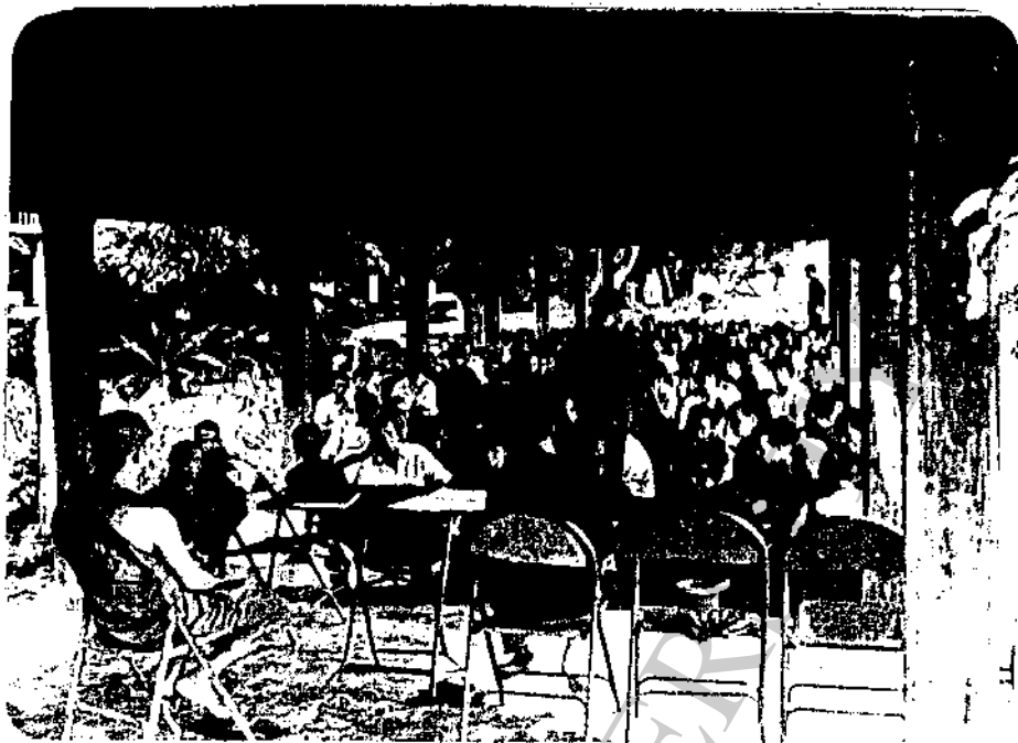
การประชุมชาวบ้านหมู่ที่ 4 ตำบลหลวงเหนือ อ.คอยสะเก็ด จังหวัดเชียงใหม่ โดยมีผู้ใหญ่บ้านเป็นผู้นำเป็นการประชุม มีเจ้าอาวาส วัดศรีมุงเมือง และกำนันตำบลหลวงเหนือ เป็นประธานในการประชุม จัดประชุมที่ศาลาภายในวัด