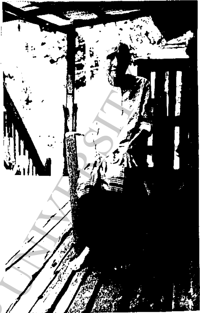
อัยยุก โบสุพันธ์ อายุ 98 ปี เจ้าของบ้านแบบไทลื้อ