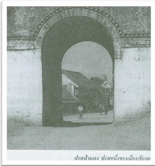
ประตูป่าแดง ประตูหนึ่งของเมืองเชียงตุง

เมืองที่มี 7 เชียง 3 จอม 9 หนอง 12 ประตู คือ เมืองเชียงตุง ซึ่งประกอบด้วยหมู่บ้านทั้งเจ็ด อันประกอบด้วย เชียงยั้ง เชียงจัน เชียงลาน เชียงงาม เชียงขุ่ม เชียงจัน และเชียงงาม 3 จอมนั้น ได้แก่ เนินเขาในเมืองเชียงตุงอันประกอบด้วย จอมมน จอมคำ และจอมสัก ซึ่งแต่ละจอมก็จะมีพระธาตุเจดีย์สำคัญตั้งอยู่ ส่วน 12 ประตูนั้น ได้แก่ ประตูเมืองทั้ง 12 ประตูอันมีชื่อว่า หนองผา ยางปั้ง น้ำบ่ออ้อย ม่าน ป่าแดง งามฟ้า เชียงลาน ผาหยั่ง เจนเมือง ยางคำ ไก่ให้ และหนองเหล็ก ประตูทั้งสิบสองนี้ตั้งอยู่