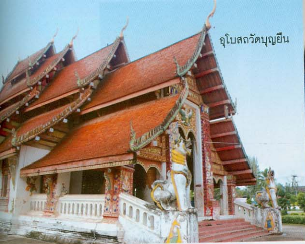
อุโบสถวัดบุญยืน