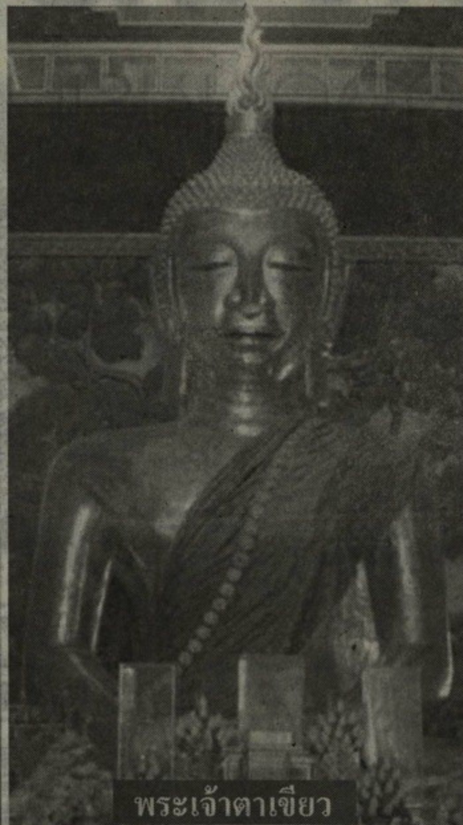
พระเจ้าตาเขียว

วัดบ้านเหล่าในอดีต มีเรื่องเล่ากันว่าตอนที่ พระพุทธเจ้าเสด็จมาบริเวณวัดบ้านเหล่าพระเจ้าตาเขียว ซึ่งมีเจ้าลัวะผู้หนึ่งชื่อว่า "เม็งคะบุตร" กำลังทำไร่อยู่ เมื่อเห็นพระพุทธเจ้าก็เกิดความกลัวจึงวิ่งหนีไป พระอินทร์และเหล่าเทพยดาที่เสด็จตามมาด้วย จึงตามไปบอกให้ทราบว่าเป็นสมเด็จพระสัมมาสัมพุทธเจ้า เสด็จมาโปรดเวไนยสัตว์ เมื่อประชาชนในแถบใกล้เคียงได้ทราบก็เดินทางมาฟังธรรมของพระองค์ ขณะเดียวกันก็แสดงอานิสงส์สร้างพระพุทธรูปให้จนเป็นที่เลื่อมใสกับผู้ที่ได้ฟังทุกคน ครั้นจบลง พระอินทร์ซึ่งเป็นประธานในที่นั้น จึงกราบขอพระเกศาพระพุทธเจ้า เพื่อประดิษฐานไว้ ณ ที่ตรงนั้น เพื่อให้เป็นที่เคารพสักการะแก่นุชนรุ่นหลัง พระพุทธเจ้าจึงประทานเกศาแก่พระอินทร์ โดยขุดบรรจุไว้ในอุโมงค์ เพื่อกันขโมย จากนั้น