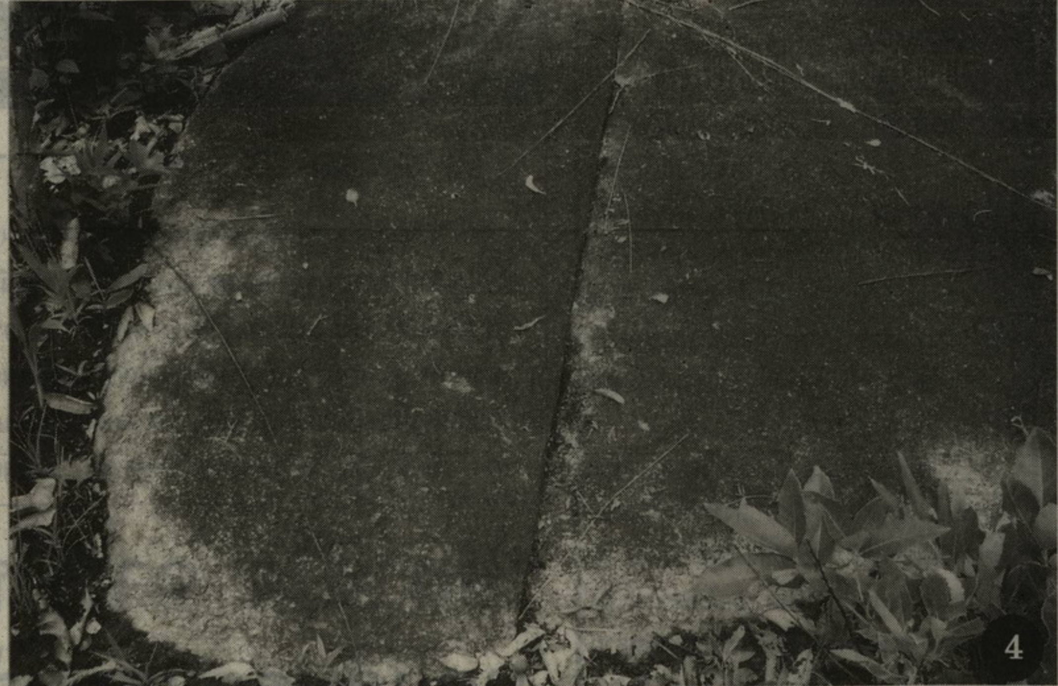
1. หินที่สกัดเป็นรูปสี่เหลี่ยมขนาดใหญ่ กองเต็มบริเวณลานหิน มองเห็นร่องรอยการสกัดได้ชัดเจน 2. บริเวณหน้าผามีรอยแกะสลักมองเห็นได้ แต่ไม่ชัดเจนว่าเป็นรอยหรือรูปอะไร เพราะมีตะไคร่น้ำและไลเคนเกาะเต็มไปหมด