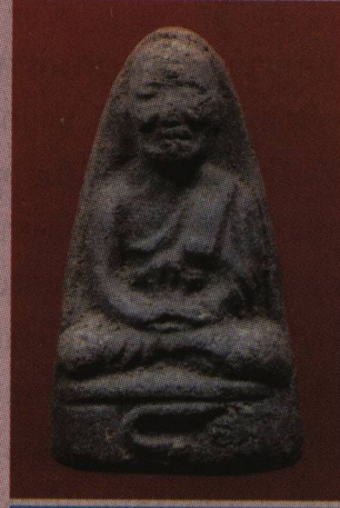
พระหลวงพ่อกวด พิมพ์ใหญ่ฐานรอยพระบาท เนื้อสีเทา