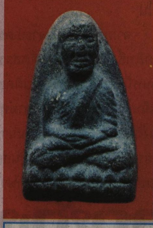
พระหลวงพ่อกวด พิมพ์กลาง เนื้อสีดำ