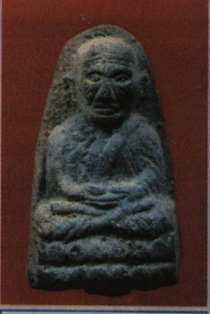
พระหลวงพ่อกวด พิมพ์เล็ก เนื้อสีเทา