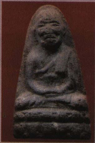
พระหลวงพ่อกวด พิมพ์ใหญ่ฐานบัว เนื้อสีเทา