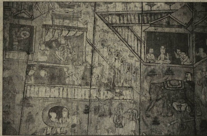
ภาพเขียนฝาผนังเรื่องวรวงศ์หงษ์อำมาตย์