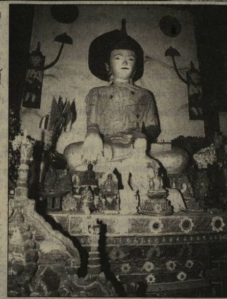
พระประธานอายุร้อยกว่าปีวัดสบลี้

เพื่อนคนหนึ่งโทรศัพท์มาต่อว่าถึง บทความในช่วงเวลา 2 อาทิตย์ที่ ผ่านที่ผมนำเสนอเรื่องราวความ มหัศจรรย์แห่งอำเภอเมืองปาน ซึ่งน้อยคนนัก จะรู้ว่าเป็นที่ตั้งของอุทยานแห่งชาติแจ้ซ้อน เพื่อนคนเดิมโอดครวญว่า ทำไมถึงเขียนแต่ เรื่องแจ้ซ้อน ไม่ผัดนักที่เพื่อนคนนั้นจะคิดเช่นนี้ แต่ทั้งนี้ต้องเข้าใจว่า การเดินทางท่องเที่ยวก็ คือการเปิดโลกทัศน์ใหม่ให้กับชีวิต สิ่งใดที่ พบพานจากการท่องเที่ยวแล้วเกิดความ ประทับใจ ถือว่าการเดินทางดังกล่าวทำให้เรา "ได้" ความรู้สึกดี ๆ ที่ปราศจากการหลงกลวงซึ่ง บางครั้งหาไม่ได้ตลอดช่วงเวลาของการทำงาน ที่สำคัญสถานที่ทุกแห่งล้วนแล้วแต่มีจุด ประทับใจตามแต่ที่ว่าใครจะเลือกมองเลือกชม เหมือนกับที่แจ้ซ้อนที่ตรึงอยู่ในใจของผมและ มักมีเรื่องราวความประทับใจทุกครั้งที่มาเยือน หลายคนมัวแต่หลงเหลืออยู่กับอะไรที่ ใหญ่โตมโหระทึก หรือบางสิ่งทีสร้างขึ้นตาม กระแส แต่นึกไม่ถึงว่าวันหนึ่งเมื่อย่าเท้ามาที่ แจ้ซ้อน กลับพบสิ่งเล็กๆ ที่น่าทึ่งและตราตรึง ใจไปอีกแสนนาน