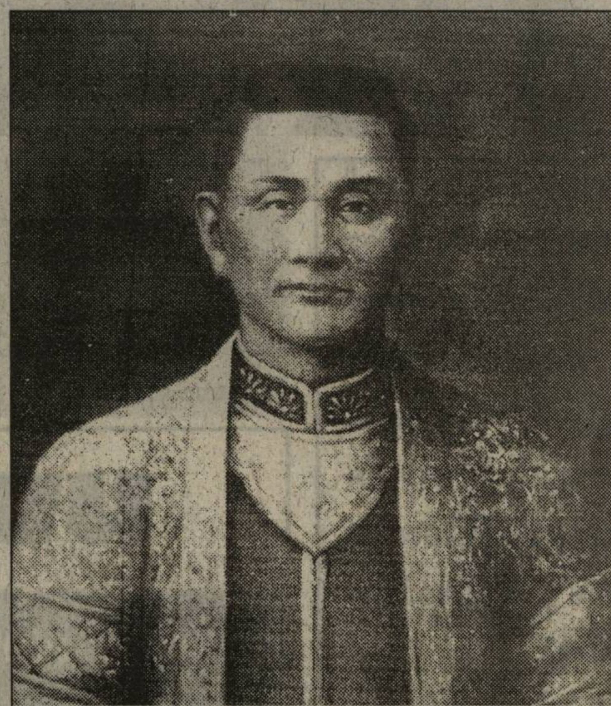
พระเจ้ากาวิละ

เมื่อกษัตริย์ทั้งสามพระองค์ทรงปรึกษาหารือกันแล้ว พญามังรายจึงได้ตกลงพระทัยที่สร้างเมืองใหม่ขึ้นมา ณ ที่ราบเชิงดอยสุเทพแห่งนี้ โดยสร้างกำแพงเมืองด้านกว้าง 800 วา ด้านยาว 1,000 วามาบรรจบเป็นรูปสี่เหลี่ยมผืนผ้า ครั้นเมื่อได้เวลาฤกษ์ก็ได้ลงมือขุดคูเวียงและก่อปราการด้านทิศอีสานอันเป็นที่ศรัทธาก่อนแล้วอ้อมไปทิศทักษิณไปรอบสี่ด้านพร้อมทั้งตั้งตลาดไปด้วยกันเป็นเวลาสี่เดือนจึงแล้วเสร็จสมบูรณ์ กษัตริย์ทั้งสามพระองค์ทรงขนานนามเมืองนี้ว่า “นพบุรีศรีนครพิงค์เชียงใหม่”