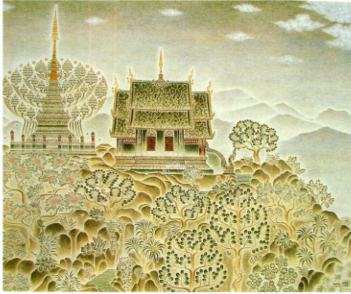
๑ วัดพระธาตุนางคอยคอยผาม้า

ในวันที่อากาศสดใส ก้องฟ้ากว้างใหญ่ ฤๅเสียดตา มีก้อนเมฆน้อยใหญ่ประดับประดา คล้ายกับว่าก้อนเมฆเหล่านั้นเป็นลอยเรื่อยมา หยอกเย้าคลอเคลียอยู่เป็นเพื่อน บนยอด ดอยสูงที่อยู่ใกล้สายตามีฉากหลังเป็นทิวเขา สลับซ้อนกันไปไกลสุดสายตานั้น ส่วนแต่ เขียวขจีไปด้วยพืชพันธุ์ไม้บานาที่เติบโตขึ้น สดชื่นระหว่างหินผาอันแข็งเกร็ง แต่ละต้น ส่วนแต่มีรูปทรงกิ่งก้านแตกต่างกันไป บางมี ใบเรียวยาวแหลม บางใบกลมมน บางก็มีใบเรียง ซ้อนกันเป็นร่องขึ้นมาตา บางต้นก็พุดดอก สีสวยให้ได้ยล บางต้นก็เป็นหลักฟิ่งฟิ่งให้ ไม้ส้อยได้ทอดตัวพันเกี่ยวไปตามลำต้น