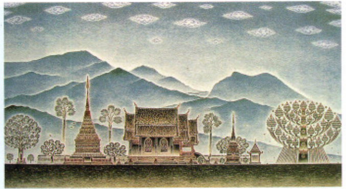
๑ วัดแม่คำสบบเป็น

เป็นเวลากว่ายี่สิบปีที่เขาได้เพียรสร้างงานศิลปะที่เกี่ยวข้องกับพุทธศาสนาออกมาอย่างสม่ำเสมอ และสำหรับบ้านเกิดของเขาซึ่งถือเป็นอีกดินแดนหนึ่งที่พุทธศาสนาเจริญอย่างยิ่งนั้น เขาได้ถ่ายทอดเอาความงดงามของสถาปัตยกรรม