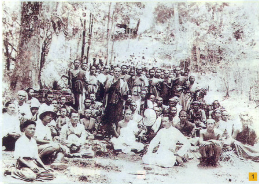
1. ถ่ายพร้อมกับคณะ ผู้ร่วมสร้างทางตรงเชิงบันไดนาค วัดพระธาตุคุดอยสุเทพ พ.ศ. 2477