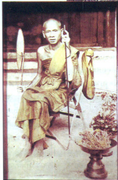
ถ่ายที่หน้าวิหารวัดบ้านปางหลังเดิม ก่อนจะรื้อสร้างใหม่ อายุ 59 ปี พ.ศ. 2480

อายุ 10 ปี ขณะจะไปเลี้ยงควาย มีพระธุดงค์ผ่านมาพบ และบอกว่าถ้าได้บวชเรียนจะเป็นผู้นำสำคัญในการสืบพุทธศาสนา แต่เนื่องด้วยเห็นพ่อแม่ยังลำบาก จึงอยู่ช่วยงานทางบ้านก่อน จนอายุได้ 17 ปี จึงรีบเร่งขอพ่อแม่บวช พ่อแม่ทนรบเร้าไม่ไหว จึงนำไปฝากกับครูบาชาติยะ ฟ่านักอยู่ ณ อารามสงฆ์บ้านปาง เป็นชะโยม