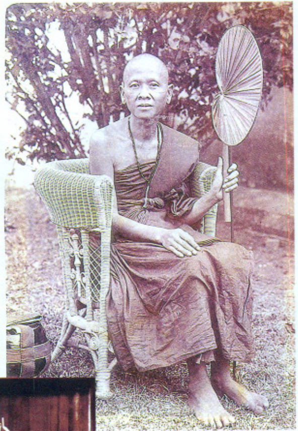
ถ่ายที่ต้นขบาบพระธาตุจอมทอง คราวบูรณะวัดพระเจ้าตนหลวง และพระธาตุจอมทอง จ.พะเยา อายุ 46 ปี พ.ศ. 2467

ต.ช.เพื่อน หรือฟ้าร้อง เป็นเด็กที่มีจิตใจโอบอ้อมอารี ไม่ทำร้ายทุบตีสัตว์ ไม่กินเนื้อสัตว์ ชอบกินผักผลไม้ นอกจากนั้นยังชอบเสียงดนตรี ชอบติดซิงเปาขลุ่ย ขับจ้อยซอ ศิลปะพื้นบ้านล้านนา ชีวิตแต่ละวันดำเนินตามวิถีของลูกชาวนาที่ต้องช่วยพ่อแม่เลี้ยงควาย ทำไร่ทำนาในช่วง