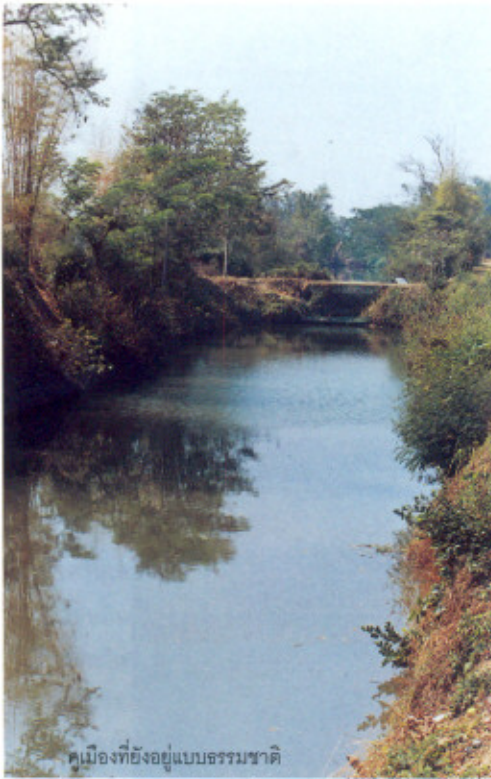
ทเมืองที่ยังอยู่แบบธรรมชาติ