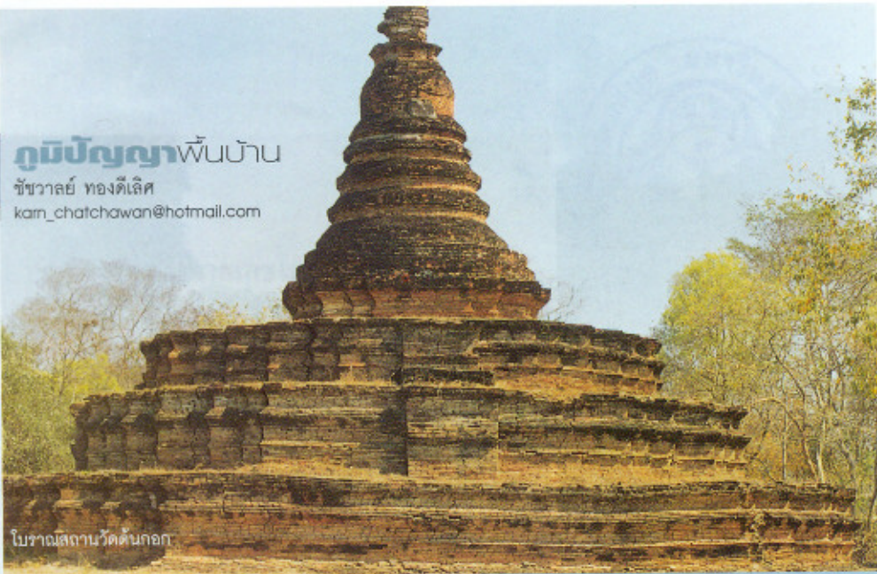
โบราณสถานวัดต้นกอก