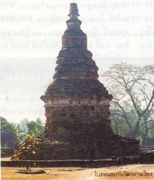
โบราณสถานวัดกลางเวียง