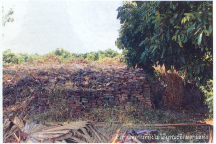
ปูลาดจากขี้ยังไม่ได้บ่มระเหยกลิ่นคาวเหม็น

อำเภอสันป่าตอง กาดวัวทุ่งฟ้าบด พอดีทุ่งเสี้ยว เสี้ยว ซ้ายตรงไฟเขียวไฟแดง เข้าไปซัก 2 กิโลเมตร มีชุมชน ยินดีต้อนรับสู่เวียงท่ากาน ช้างวัดเวียงท่ากาน รยन्द จอดเต็มทั่ว ทุกคนทยอยเดินตรงไปยังปะรำที่มุงด้วย ใบตองตึงเรียกว่า 'ผามเปียง'