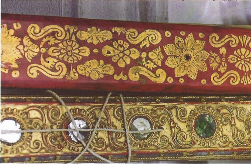
ไม้ประดับธรรม ลาวดลางดงงาม