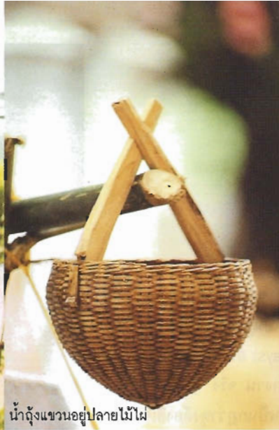
น้ำถุ้งแขวนอยู่ปลายไม้ไผ่