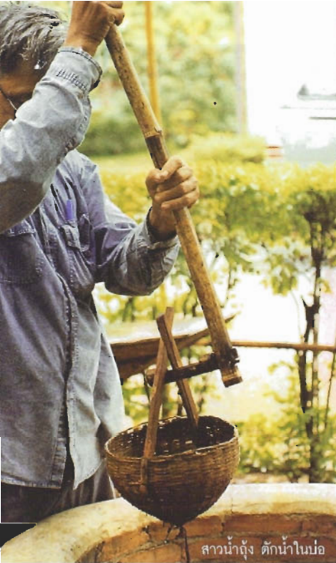
สาวน้ำถุ้ง ตักน้ำในบ่อ