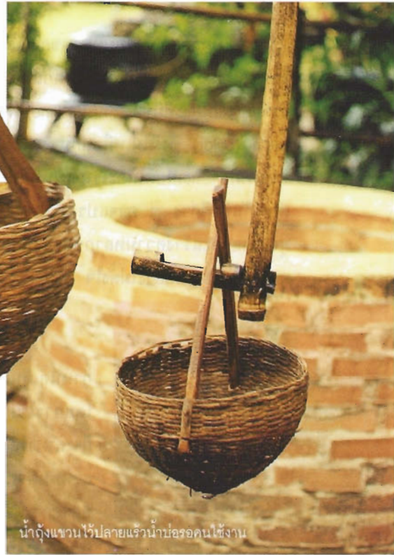
น้ำตุงแขวนไว้ปลายแรวน้ำบ่อของคนใช้งาน