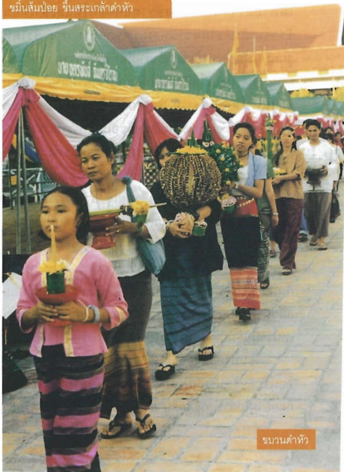
ขบวนดำหัว

เสียงซ้องเสียงกลองดังเป็นจังหวะให้สาวช่างพ้อน และให้บ่าวได้พ้อนดาบพ้อนเชิงเมื่อขบวนดำหัวไปถึงบ้านพ่ออู๋แม่อู๋ ลูกหลาน