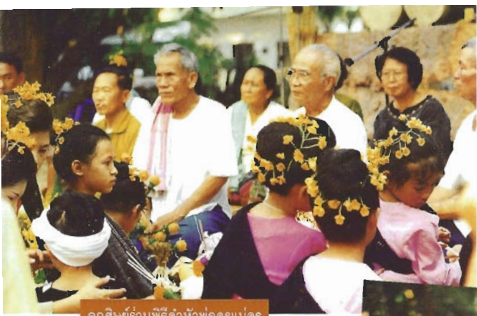
ลูกศิษย์ร่วมพิธีดำหัวพ่อครูแม่ครู

จะนำพานข้าวตอกดอกไม้ รูปเทียน ข้าวของที่เตรียมมาพร้อมด้วยน้ำ ชมื่นส้มป่อยเข้าไปมอบให้ท่านพร้อม กับกล่าว "วันนี้เป็นวันปีใหม่ ลูกหลาน ทั้งหลายได้ร่วมกันมาขอขมา สิ่งใด ที่ได้ล่วงล้ำก้ำเกินทั้งกายกิติ วาจากิติ ใจกิติ ขอให้อโหสิกรรมแก่ผู้เข้า ทั้งหลายด้วยเถิด"