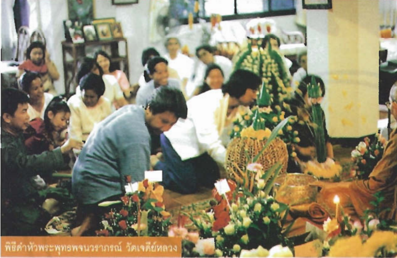
พิธีดำหัวพระพุทธรูปนาราภรณ์ วัดเจดีย์หลวง

รดดอกกล้วยมหน้าแล้ง ลมร้อนแรงยามเที่ยง บ่าย ไบไม่เปลี่ยนสีจากเขียวเป็น สีเหลือง สีแดง สีส้ม แล้วปลิดใบ หมุนคว้างร่วงลงสู่พื้นดิน การ ต่อสู้กับความแห้งแล้งที่กำลังมา เยือนของต้นไม้ ทั้งใบแก่ลดการ คายน้ำที่รากดูดขึ้นมาหล่อเลี้ยง ลำต้นได้น้อยลง สะสมอาหารให้ ใบอ่อนที่กำลังค่อย ๆ ผลิตาน เติบโตทำหน้าที่หล่อเลี้ยงต้นไม้ หมุนวนเช่นนี้ครั้งแล้วครั้งเล่า เช่นเดียวกับเทศกาลสงกรานต์ ปีใหม่ของไทยหมุนวนมาถึงอีก รอบแล้ว