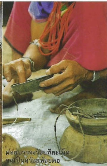
สว่านบรรจุรอยที่ละเอียด จนเป็นสร้อยห้อยคอ

เอาปลายแหลมของสว่านปักลงบนเนื้อกะลา ใช้มือหมุนไม้ก้านสว่านให้เส้นฝ้ายม้วนพันก้านสว่าน ดึงรั้งเอาไม้กดหมุนขึ้นไปด้านบน เอามือกดไม้กดหมุนลงมา แรงที่กดจะดึงให้ก้านสว่านหมุนพร้อมกับก้อนดินเผา กดจนสุดความยาวของเส้นฝ้าย เหลาแรงกดที่มือ แรงเหวี่ยงของก้อนดินเผาจะพังก้านสว่านให้หมุนต่อไป พันม้วนเส้นฝ้ายเข้ากับก้านสว่าน กดไม้กดหมุนอีก ก้านสว่านก็จะหมุนกลับไปกลับมา เมื่อกดอย่างต่อเนื่อง มีจังหวะจะโคน จะทำให้สว่านหมุนตัว ๆ เจาะกรีดสลักลงบนเนื้อกะลา ปลายแหลมของสว่านเจาะเป็นรูเล็ก ๆ ตรงกลาง ตรงรอยผ่าบนตัวเหล็ก