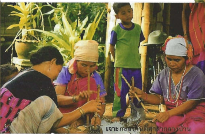
เจาะกะลาที่บ้านกลางบ้าน

ชาวบ้านน้ำบ่อน้อยใช้สว่านเจาะกะลาแทบไม่ต้องมองเลย กดพรวด ๆ กลับด้านกะลากดพรืด ๆ เสร็จแล้ววางกองรวมกันไว้ในจานที่ทำมาจากไม้ นั่งเจาะกันไปด้วยคุยกันไปด้วย