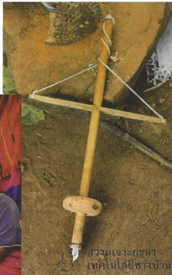
สว่านเจาะกะลา เหล็กในมือชาวบ้าน