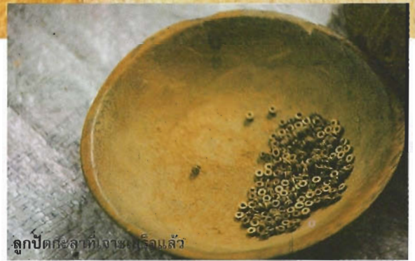
ลูกปัดกะลาที่เงางามเสร็จแล้ว

บริเวณศาลากลางบ้านน้ำบ่อน้อย เสาไม้ไผ่สูงมุงทศาคาบลานดิน รายรอบไปด้วยบ้านหลังเล็ก ๆ เด็กวิ่งไล่กันไปมา ผู้เฒ่าผู้แก่ แม่บ้านแม่เรือนเด็ก กำลังนั่งทำอะไรกันอยู่ พื้นฟ้าสีขาวชายมีแถบสีแดงไฟกอยู่บนหัว เสื้อก่อนบนเป็นสีดำ สีน้ำเงิน ส่วนก่อนล่างเป็นแถบลายทอสีแดง พ้ากุงพื้นสีแดงแซมด้วยลายเล็ก ๆ สีขาว สีดำ สีเหลือง มองดูแล้วแดงไปทั้งตัว ข้อมือใส่กำไลเงินบิดเกลียว บางคนใส่สร้อยลูกปัดหลากสี บางคนใส่สร้อยเงิน บางคนใส่สร้อยกะลา สีสนิการแต่งกายของผู้หญิงแม่เรือนชาวปาเกาะญอช่างมีเอกลักษณ์สะดุดตา