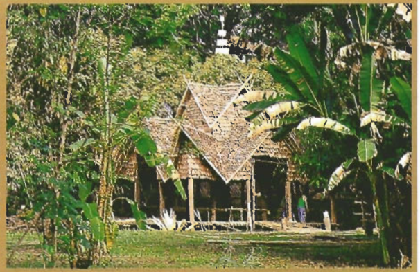
โฮงเขียนสืบสานภูมิปัญญา

หน้อยเถาะ ได้แต่เปิดทองพระ แต่ไม่เคยรู้มาก่อนว่าเขาทำกันอย่างไร