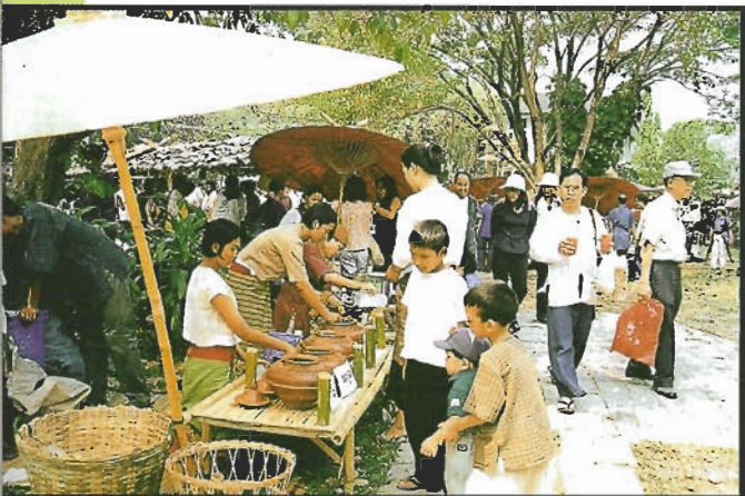
น้ำสมุนไพร กระบอไม้ไผ่

“ท่านใดสนใจที่จะมาสมัครเป็นสมาชิกชุมชนคนรักป่า มาช่วยสนับสนุนชุมชนในการรักษาป่า เชิญทางนี้เลยนะเจ้า” เสียงอาสาสมัครดังมาไม่ขาดสาย เดินจนเมื่อเย็นเต็มแก่ คอเริ่มแห้งผาก แห่ม...ช่างพอดิบพอดีเสียนี้กระไร ผมรีบเดินเข้าไปที่ซุ้มน้ำสับसानล้านนา เด็กสาวสองคนแต่งกายในชุดพื้นเมืองมือถือน้ำบายที่ทำจากกะลามะพร้าวคอยตักน้ำสมุนไพร พวกน้ำกระเจียว น้ำมะตูม น้ำตะไคร้ น้ำเก็กฮวย น้ำลำไย ในหม้อดินเผา เทใส่ในกระบอไม้ไผ่ ผมเลือกเอาน้ำมะตูม ต้มกินจากแก้วไม้ไผ่ในยามร้อน เดินไปดื่มไป ช่างชื่นใจเหลือเกิน