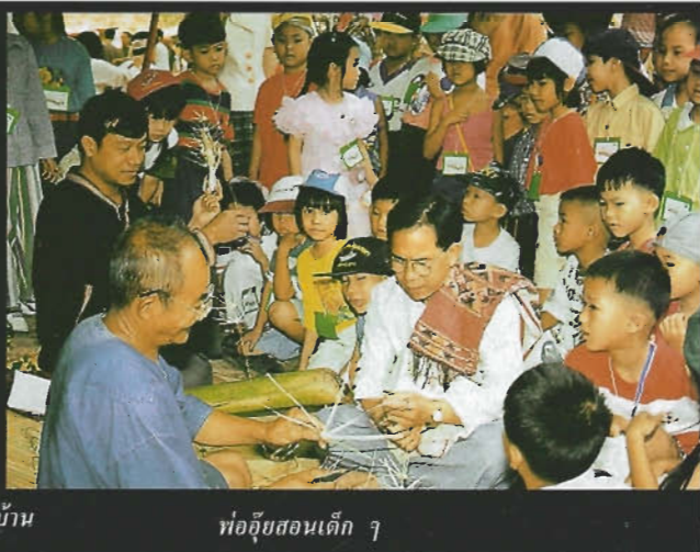
พ่ออุ๊ยสอนเด็ก ๆ

จับปลายเส้นด้ายออกแรงดึง ด้ายที่มีวนอยู่กับแกนจุดดึง แกนพากังหันหมุนตัว ๆ ๆ ดึงจนสุดเส้นด้ายแล้วผ่อนเพลามือ ใบกังหันที่หมุนเป็นวงส่งแรงม้วนเส้นด้ายเข้ากับแกน พอใกล้หมดเส้นด้ายออกแรงดึงอีก ใบกังหันหมุนกลับไปกลับมาไม่หยุด เล่นกันจนกว่าจะเมื่อยมือมันแหละ