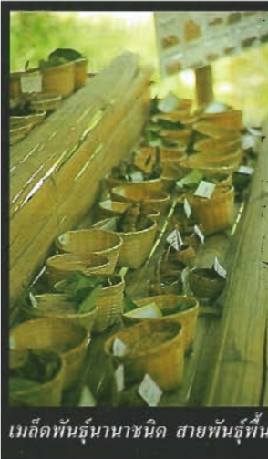
เบ็ดพันธัญนาชนิด สายพันธัญที่บ้าน

ผู้เฒ่าจากกลุ่ม ๗ ผู้เฒ่า บ้านป่าแดด อำเภอแม่สรวย จังหวัดเชียงราย กำลังสอนการทำของเล่นที่เด็กรุ่นใหม่ไม่มีโอกาสได้เห็นกัน กังหันไม้ไผ่ มีด้ามจับที่ทำจากกระบอไม้ไผ่ ใบกังหันเหลาทำให้แบน มีแกนไม้ไผ่สอดใส่ลงในกระบอตามไม้ไผ่ ด้ายเส้นเล็ก ๆ ผูกมัดกับแกนกังหัน สอดออกมาทางรูที่บากไว้ที่ด้ามเหนือมือที่จับกำถือ เอามือหมุนกังหันให้ด้ายที่ผูกติดอยู่ม้วนหมุนเข้ากับแกน มือ