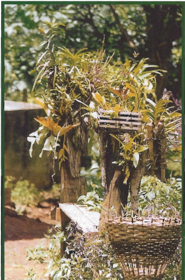
ช่อล่อปักไว้ใส่เศษขยะ

ตกแต่งช่อดอกไม้บนานาพันธุ์ ประดับประดาสถานที่ ดูมีเสน่ห์แบบพื้นบ้าน