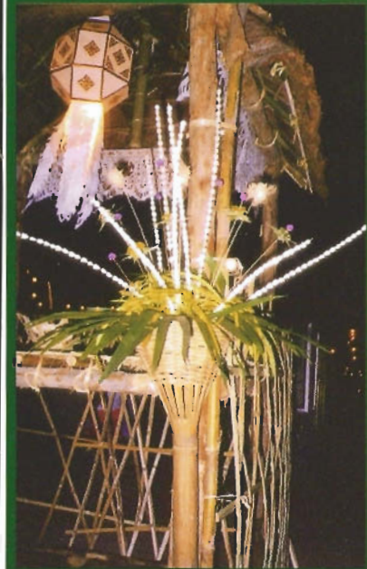
จัดแต่งดอกไม้ในงานเทศกาล