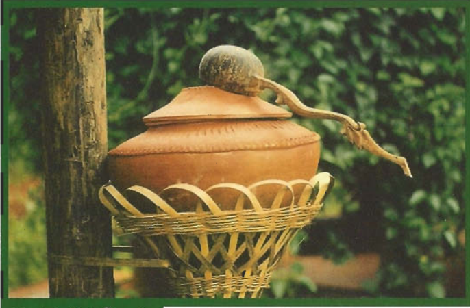
ช่อล่อไม้ไผ่ ตั้งหม้อ น้ำไว้ดื่มกิน

ยาวเท่าอก เอามีดผ่าจากด้านบนลงเป็นซี่เล็ก ๆ โดยให้ยาวสักคอกหนึ่ง หากจะให้ดีต้องผ่าไปจนสุดข้อ ข้อไม้ไผ่ที่แข็งแรงจะช่วยยึดไว้ไม่ให้ลำไม้ไผ่แตกลามลงไปข้างล่าง