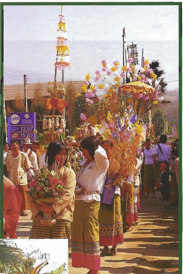
พุ่มดอกไม้ในซอล้อถือในชบวนแห่

ลีลาการทำ การสานซอล้อไม้ไผ่นั้น เขาว่าต้องดูกันที่ตรงปากที่อยู่ด้านบนสุด