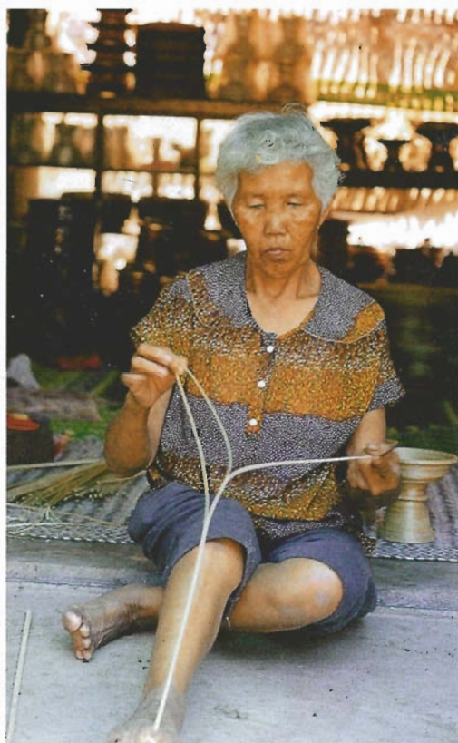
จักจี้กเส้นดอกออกเป็นเส้นบาง