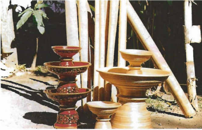
ลงสีวาดลวดลาย