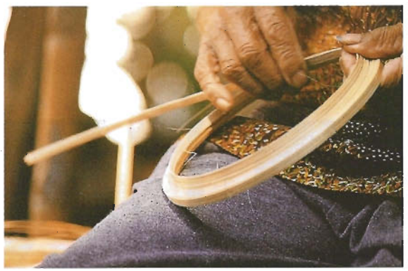
มือจับขดวงซ้อนเป็นชั้น ๆ