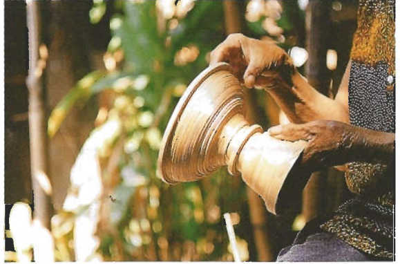
เสร็จเป็นพานไม้ไผ่สวยสดงังใจ

ในโรงเรียนเล็ก ๆ หลังบ้านที่สร้างขึ้นแบบง่าย ๆ หมึงสูงวัย ผมหัสติดอกเลา นั่งอยู่กับพื้น มือหนึ่งจับกระบอกลูกไม้ไผ่ปล้องยาวให้ปลายกระบอกลูกตั้งขึ้น อีกมือหนึ่งกำมิดปลายแหลม แขนหนีบตามยาวของมิดกระชับไว้ได้รักแร้ มือดึงกระบอกลูกไม้ไผ่เข้าหาตัว อีกมือดันปลายมิดคมมาดลึกลงจักแบ่งเนื้อไม้ไผ่ออกเป็นซี่เท่า ๆ กันโดยไม่ต้องรอไม้บรรทัดวัด