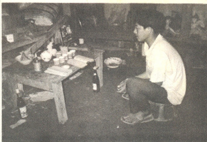
▲ หมอมีกำลังเช่นไหว้บรรพบุรุษในบ้าน ◀ การต้มเหล้า

ทั้งรสและกลิ่น คนพื้นถิ่นเขากินกันอย่างเอร็ดอร่อย แต่คนที่คุ้นเคยกับรสเผ็ดของพริก กลิ่นหอมของกะเพรา และกลิ่นรุนแรงของกระเทียมเช่นพวกเรา ต้องถือว่าเป็นรสชาติแปลกใหม่ที่ยังไม่เจนนั่น