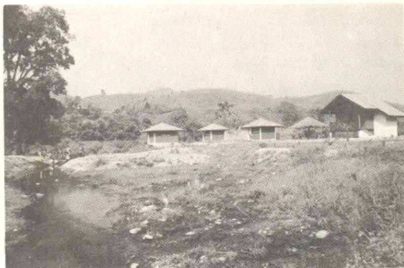
บ่อน้ำร้อน บ้านน้ำทิพย์ หลังถูกปรับแต่งเป็นสถานที่ท่องเที่ยวแบบทันสมัย

ขบวนส่งเจ้าสาวสลายไปเมื่อเจ้าสาวเข้าที่พัก ผู้หญิงแยกไปจัดเตรียมสำหรับกับข้าวรับแขก พวกผู้ชายก็ แยกย้ายกันเป็นกลุ่ม ๆ บ้างนั่งคุยกัน บ้างก็ปล่อยอารมณ์ เบิกบานอยู่กับอินดั่ง ซึ่งก็คือการสูบกถ้อง ตัวอินดั่งทำ ด้วยไม้ไผ่บ้องเท่านั้น มีก้านกรวยเสียบข้าง เต็มน้ำลางกัน