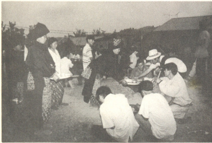
รับรองแขกด้วยเหล้าต้มและน้ำชา ที่ลานต้อนรับเจ้าสาว

สำหรับสินสอดที่เจ้าบ่าวจะต้องให้แก่พ่อแม่ของเจ้าสาว นิยมจ่ายเป็นเงินแท่ง ซึ่งส่วนใหญ่เป็นสมบัติเก่าแก่ที่ตกทอดกันมา หากไม่มีเงินแท่งจะให้เงิน (บาท) ก็ได้