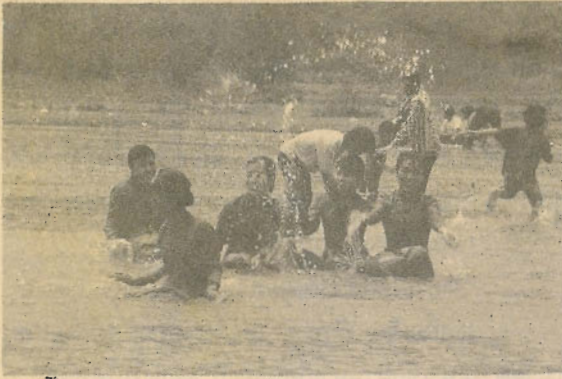
น้ำขึ้นช่วงปีใหม่ คึกคักไปด้วยผู้คน

เจ้าฟ้าเคยว่า” เป็นคำตอบของพ่อลุงเบิ่งผ่านลำจามแก้ว ลุงเบิ่งวัย 61 ปี เป็นผู้นำคนบนคอยในหมู่บ้านกองขาง จำนวน 24 คนมาที่นี้เพื่อบูชาสิ่งศักดิ์สิทธิ์ ไหว้ผีบ้านผีเมือง และปฏิบัติตามวิถีบรรพชน ชายทั้ง 24 คนต้องเปลี่ยนเสื้อ และโพกหัวด้วยผ้าแดงที่คณะกรรมการจัดให้ จากนั้นพวกเขาจะสลับบ้างเปลี่ยนกันตีกลองชัยไม่ให้เสียงขาดช่วง