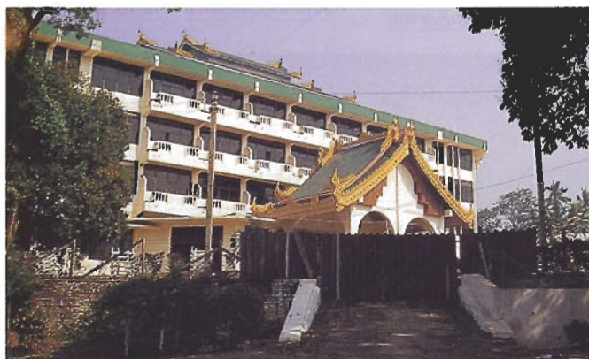
ปัจจุบัน : หอคำอายุกว่า 100 ปีถูกทุบทำลายกลายเป็นโรงแรมรองรับนักท่องเที่ยว