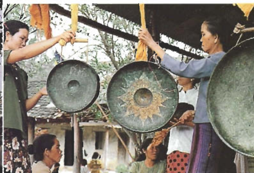
งานบุญในเชียงตุง ผู้หญิงมีบทบาทไม่น้อย