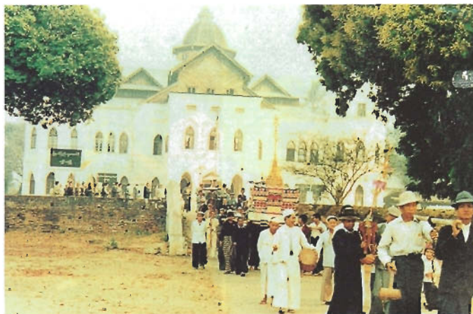
อดีต : ขบวนแห่ยอดฉัตรของวัดแห่งหนึ่งในเชียงตุง เบื้องหลังคือหอคำ หรือวังเจ้าฟ้าเชียงตุง ที่สร้างขึ้นในสมัยเจ้าฟ้าก้อนแก้ว