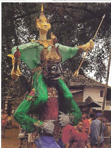
ขุนสงกรานต์ซึยกัษ

กาญแจสิดำขึ้นสนิมด้วยท่าฝนยังคงล่องประตูลึกไว้แน่น เป็นเดือนแล้วที่ด่านแม่สายปิดตัวลง หลังฉากสงครามระหว่างขุนศึกเมิงไตกับนักรบกลุ่มเอยาวตี นี่เป็นครั้งที่สามในรอบปีที่ผมแวะมาเมืองชายแดนแห่งนี้