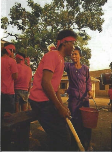
คนชุดแดงเหล่านี้ เชื่อกันว่าต้องเป็นคนเผ่าลัวะ