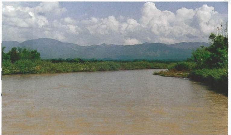
น้ำขึ้นในฤดูหนาว

ปีใหม่กำลังโฉบบินมาปกคลุมวัน-คืนในอย่างกุ่ม เวที ไม้ริมทางเท้าสร้างเรียงรายอยู่ไม่ห่างกัน เกือบหนึ่งปีเต็ม แล้วที่เทศกาลน้ำได้พาเพื่อนสาวซึ่งยังคงคบหากันอยู่ ออก มากลางท้องถนนอันชุ่มชื้น ใต้กิ่งก้านใหญ่โตของไม้ยางริม ถนน ลำพูน-เชียงใหม่