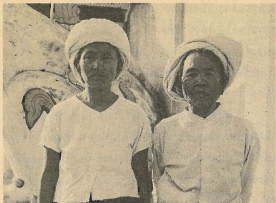
แม่เต่าไทยจีน

เนื้อความส่วนนี้ผมลอกมาจากสมุดบันทึกการเดินทางของผม บางทีเหตุการณ์ในกรุงย่างกุ้งวันนั้นอาจช่วยย้ำความตั้งใจ และระลึกถึงเชียงตุงได้ดี ด้านท่าซีเหล็กยังคงปิดเจียบ ห้ามนักเดินทางกรุยถนนกว่า 160 กิโลเมตรสู่นครเชียงตุง ทว่าโอกาสที่ย่างกุ้งยังเปิด เปิดให้ผมเดินทางซื้อตั๋ว จ่อคิวลากกระเป๋าเตรียมล่องฟ้าไปเชียงตุง ซึ่งห่างจากย่างกุ้งไปตามถนนกว่า 1,176 กิโลเมตร แต่...ที่สุดแล้วความไม่แน่นอนก็เกิดขึ้นบนความแน่นอนอีกครั้ง