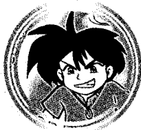
นายคดกับนายซื่อ ๑๒๔