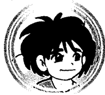
ผู้กำหนดเขวหรือบ กับวิชาความรู้อ ๑๓๙