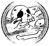
คนมีโชค ๑๔๒