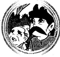
คนคิดมาก ๑๔๙