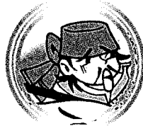
เจ้าหน๓อตุณ๓ทาน ๓๒