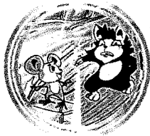
หนูกับแมว ๑๑๘