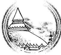
พระธาตุนหริภุช๓ชัย ๑๐๒