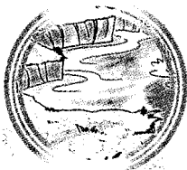
สระเขาบ่อขี้ขี้ ๑๓๒