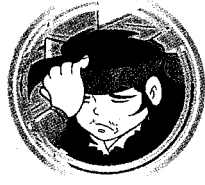
เนล็กน้ำพี้ ๓๐